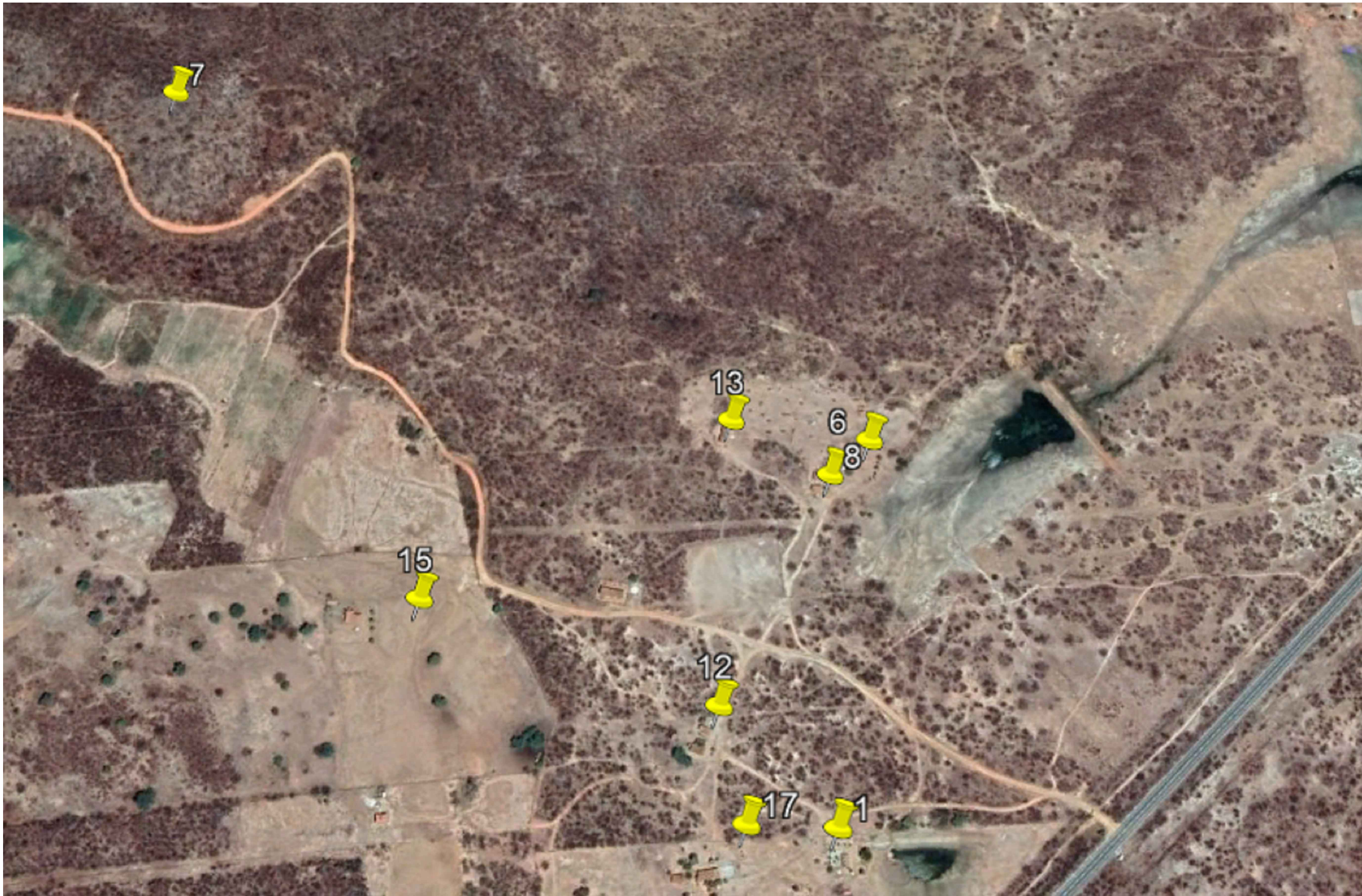
PLANTA DE LOCALIZAÇÃO - VISTA 03